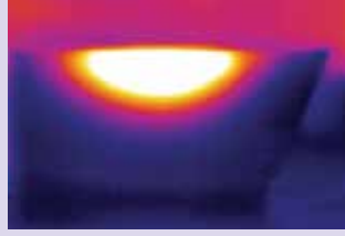
Derin ısıtma Face Shaper RF termal kamera görüntüsü

PURE kullanıcı dostu arayüzü ve hazır programları sayesinde doğru parametrelerin uzman tarafından kolayca seçilebilmesini sağlar.