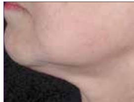
PURE TIGHT Sonrası