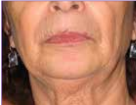
PURE FACE SHAPER Öncesi