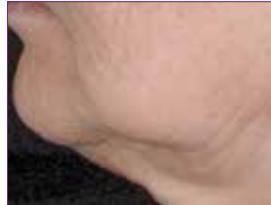
PURE TIGHT Öncesi