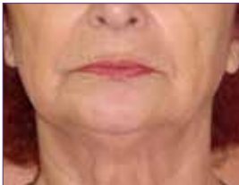
PURE FACE SHAPER Sonrası